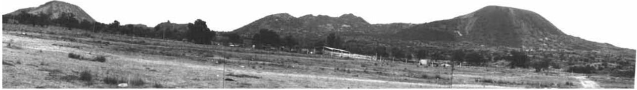
Figura 3. La Sierra de Santa Catarina vista desde el sur (Fotografía tomada en 1996).

efecto de una acción volcánica actual” (v. 4: p. 106). Explica el relieve sepultado por la acumulación volcánica, como fosas profundas, resultado de hundimientos en bloque o valles profundos controlados por fallas paralelas y escalonadas (v. 4: p. 118).