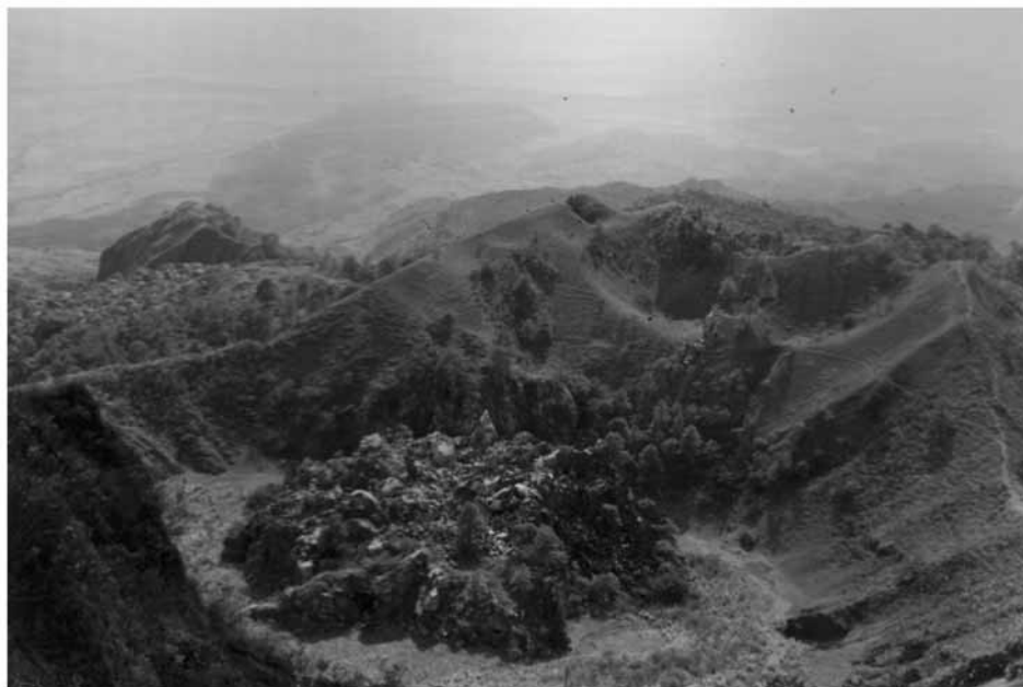
Figura 4. Cráter del volcán Ceboruco (1990), donde se aprecia el tapón de lava formado en tiempos históricos recientes.

p. 437-441) en el que explica las erupciones explosivas, la distancia a que llegaron los piroclastos y su composición mineralógica, para hacer una comparación con los contemporáneos del volcán Santa María (Guatemala).