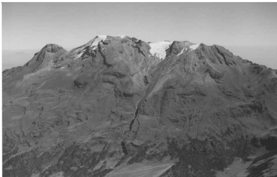
Figura 2. Volcán Iztaccíhuatl visto desde occidente (enero de 1995). El manchón de nieve de mayor tamaño es el glaciar de Ayoloco, con una longitud que es aproximadamente la mitad de lo que refirió Ezequiel Ordóñez.

poderosa erupción de 1913 modificó sustancialmente su relieve.