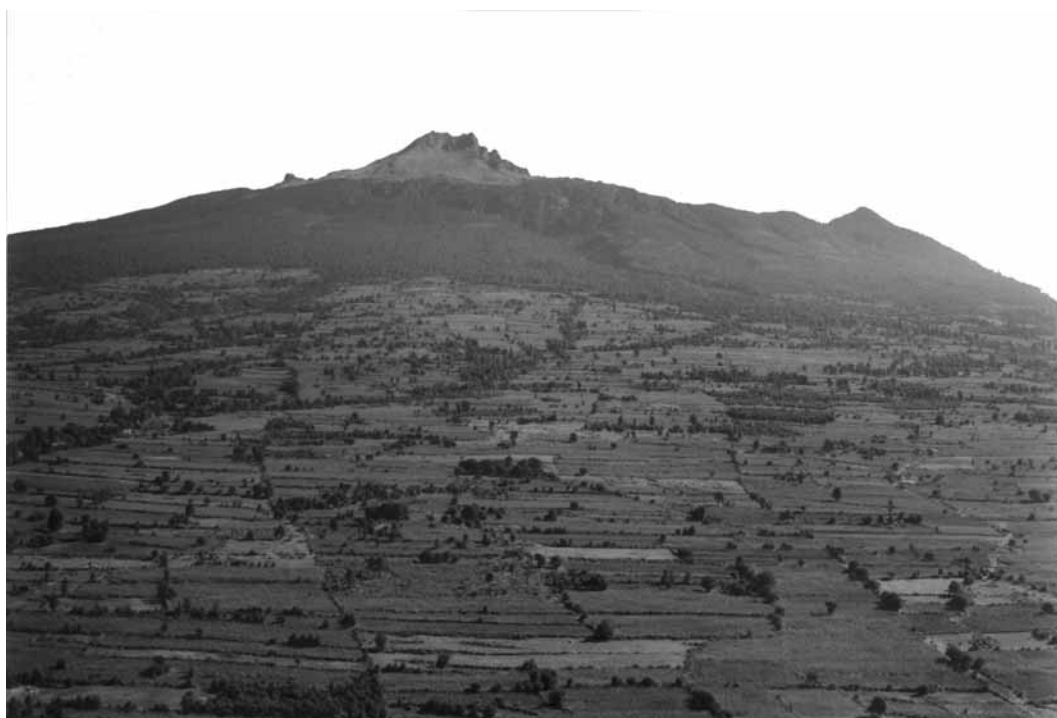
Figura 5. Volcán Matlacuéstl (1999), que en náhuatl significa mujer de la falda larga .

gión (...) el fenómeno del derrumbe ha adquirido proporciones extraordinarias ” (p. 42-43).