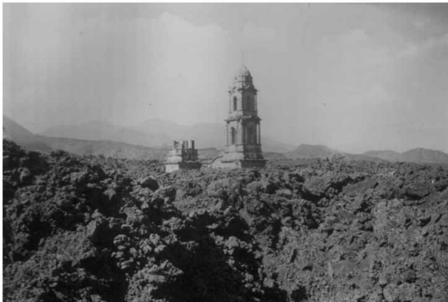
Figura 8. La iglesia de San Juan cubierta por las lavas del volcán Parícutín (1991).

aquellos días de peligros para San Juan, providencias fueron tomadas para evacuar a sus habitantes, y poco a poco se fue desdoblado la que fue cabecera de la municipalidad, trasladándose las familias al lugar llamado Los Conejos, a 10 km al poniente de Uruapan” (v. 5: p. 354).