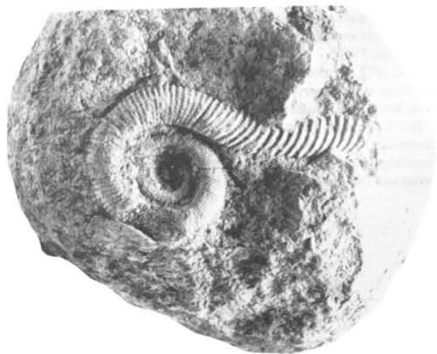
Figure 1. Macroscaphites aff. yvani (Puzos). Probable Barrémien supérieur. État de Oaxaca, sud du Mexique. X 1. ESIA-1030.