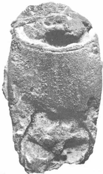
Figura 2.— Astacodes sp. cf. A. maxwelli Stenzel, (IGM-2701) Vista dorsal del caparazón (X 1).

Del abdomen se conserva un segmento incompleto fusionado al caparazón.