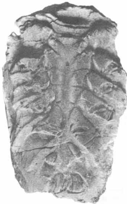
Figura 3.— Astacodes sp. cf. A. maxwelli Stenzel, (IGM-2701) vista ventral (X 1) que muestra el esternón, cinco pares de patas caminadoras, un par de maxilípedos y un par de mandíbulas, así como surcos pares en las bases de las patas, y el orificio central, que corresponden a apodemas.

Archaeocarabus McCoy, 1849 (Woods, 1925-1931) del Eoceno inferior de Inglaterra, es semejante a Astacodes en la cara dorsal y en los surcos torácico y cervical, pero difiere por presentar en el esternón, cuatro pares de tubérculos centrales. Palinurus Weber, 1795 (Glaessner, 1969, p. R471) del Turoniano al Reciente, difiere de Astacodes porque presenta surcos longitudinales profundos en el tórax. Linuparus ( Podocratus ) Geinitz, 1849 (Stenzel, 1945, p. 408) del Cretácico al Terciario temprano.