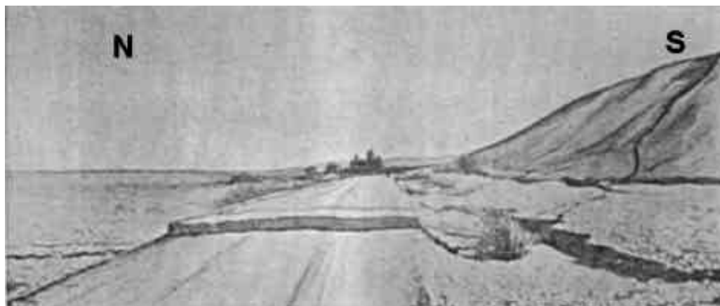
Figura 2. Falla La Laja 1. Ruptura histórica sobre la calle La Laja. (tomado de Castellanos, 1945).

Es la falla situada más al oeste, posee un rumbo N 40° E y afecta el tercer nivel de abanicos de edad cuaternaria y terrazas holocénicas, con alturas de escarpes variables desde 1.50 m hasta 10 m, y dispuestas a contrapendiente. La longitud total para este tramo es de 4 km. En la porción central de la falla se han observado