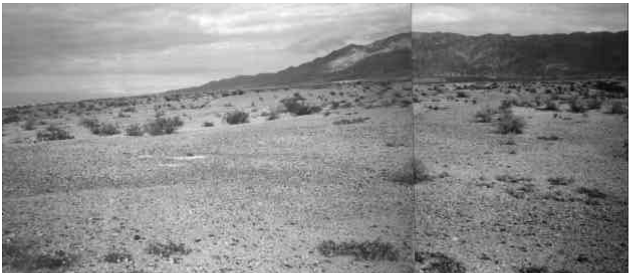
Figura 5. Barreales de falla y vegetación alineada en la falla La Laja 4.

y que pueden romperse durante el mismo sismo, la estimación de la longitud total de la falla puede resultar un poco más complicado. En el caso del área de La Laja, se ha considerado para el cálculo de la magnitud máxima del sismo probable, la sumatoria de los tramos que presentaban evidencias de ruptura histórica. De esta manera, se obtuvieron valores muy próximos a la magnitud del terremoto de enero de 1944. Esta metodología podría ser aplicada en las regiones que poseen tramos de falla discontinuos y que se asocian a sismos históricos de gran magnitud.