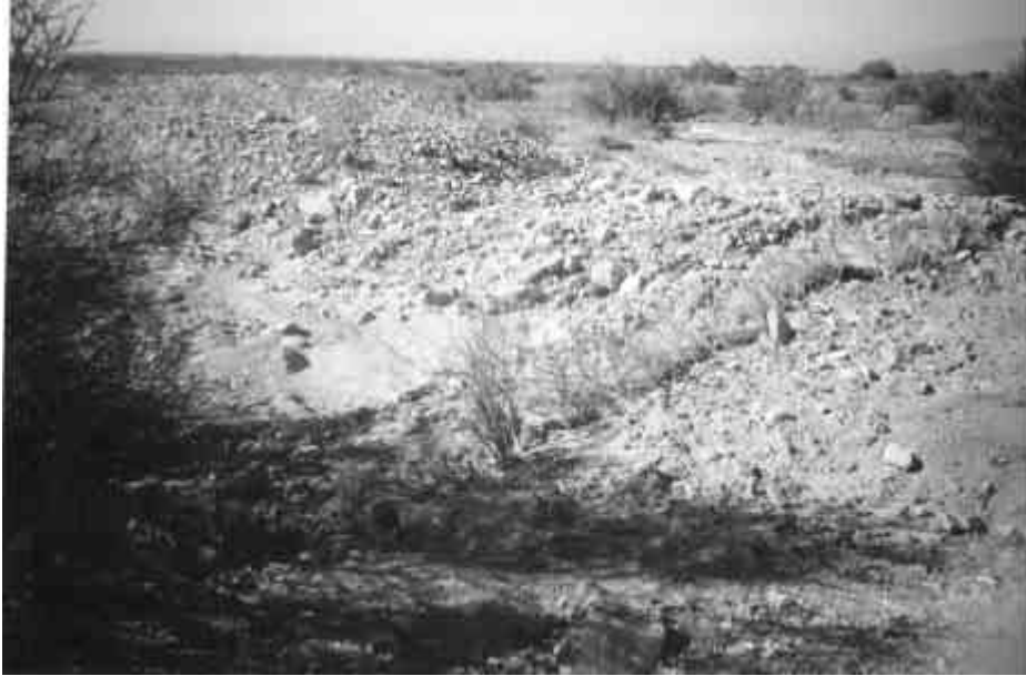
Figura 4. Ruptura histórica en la falla La Laja 3.

asociado a una sola falla para la ciudad de San Juan y departamentos aledaños a la localidad de Albardón, los cuales concentran el 90 % de la población y actividades productivas de la provincia de San Juan, daría resultados erróneos, ya que se obtendrían valores inferiores a los que se podrían esperar de un futuro sismo con características similares al ocurrido en 1944.