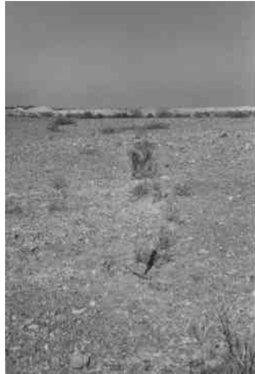
Figura 3. Ruptura histórica en la falla La Laja 2, sobre el aeródromo local.

Si se considera la sumatoria de los distintos tramos de falla (La Laja 1, La Laja 2, La Laja 3 y La Laja 4)